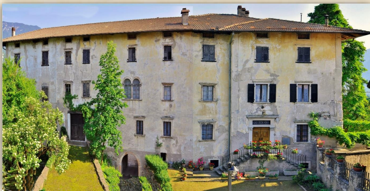
Il Castello di Mollaro