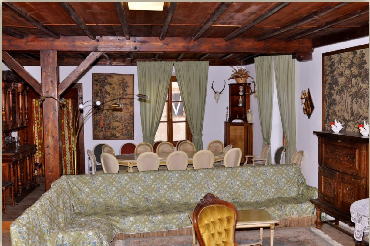
Interni del castello di Mollaro